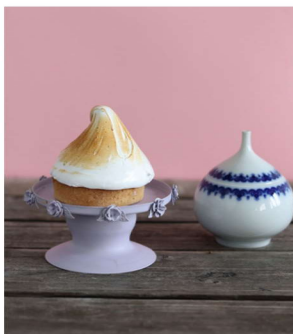
Tarta mini cytrynowa

Kruchy spód z masą cytrynową i bezą 15,50 zł/szt