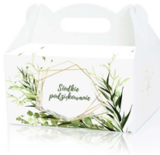
PUDEŁKO NA CIASTO GEOMETRIA ZIELONA