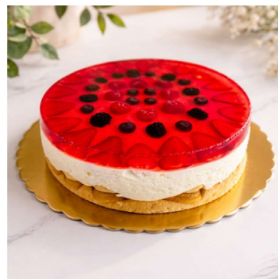
Sernik na zimno

Biszkopt z masą serową oraz galaretką z owocami