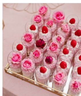
Deserek w kubeczku

Ciasto biszkoptowe z kremem do wyboru (truskawka, malina, tiramisu, panna-cotta) 10,50 zł/szt