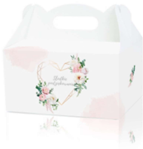
PUDEŁKO NA CIASTO PASTELOWY RÓŻ