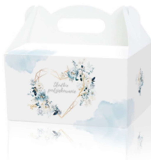
PUDEŁKO NA CIASTO BŁĘKIT