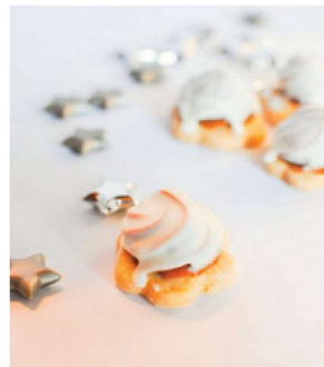
Babeczka toffi oblewana

Ciasteczka z karmelem i białą czekoladą 63 zł/kg – 30 sztuk