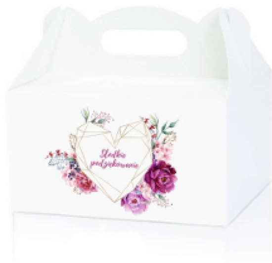
PUDEŁKO NA CIASTO GEOMETRIA FIOLETOWA